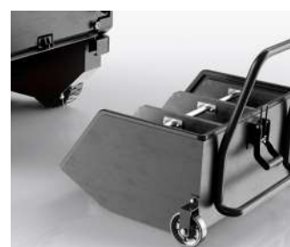
Un bac à roue avec, en option, la possibilité d'avoir 03 compartiments