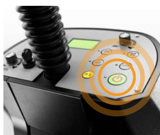
Bouton "One touch start"