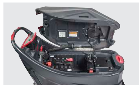
Réservoir de récupération avec poignée permettant de le faire basculer facilement