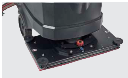
Autolaveuse orbitale pour le nettoyage des sols ou le décapage (AS7190TO)