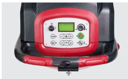
Panneau de commande intuitif avec écran LCD sur tous les modèles (AS6690T/AS7690T en photo)