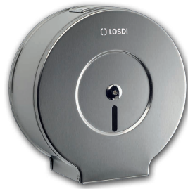
REF: CO-0202 , Finition BROSSÉ