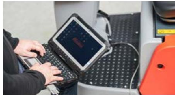
Accès facile à l'interface de diagnostic qui permet à la fois une maintenance simplifiée et la modification des paramètres.

Nous vous proposons différentes possibilités de financement individuelles et attractives, pour correspondre aux exigences individuelles et à chaque budget.