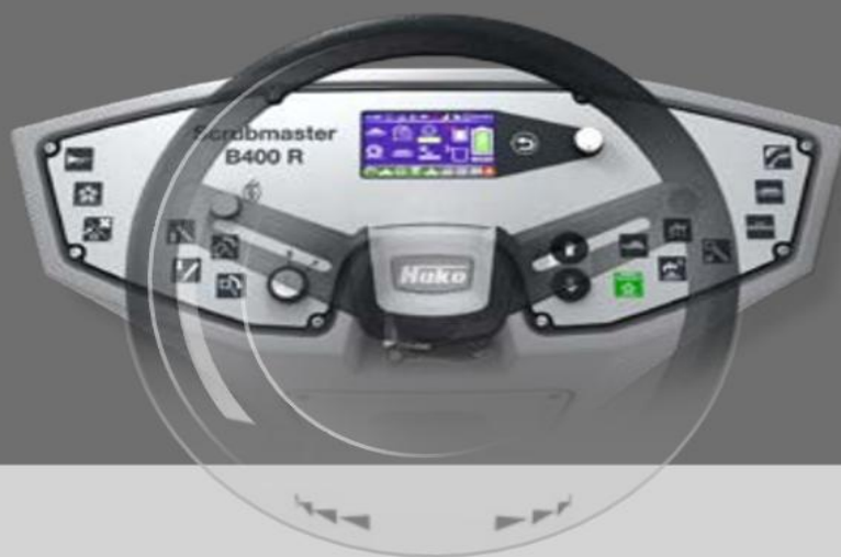
Tableau de bord

La nouvelle série Scrubmaster B400 R garantit des heures de travail en continu et des performances de surface élevées : grâce au réservoir d'eau propre de 400 litres, au réservoir de récupération des déchets et l'autonomie des batteries grâce au système de changement rapide en option (jusqu'à 12 h d'autonomie). Équipée de trois unités de brosses et d'une largeur de travail de 123 cm ou de 155 cm, de nombreux accessoires en standard et fonctionnalités Hako sont proposés : système de dosage de chimie embarquée, ergonomie du poste de travail... la nouvelle série Scrubmaster B400 R est prête pour toutes les grandes tâches.