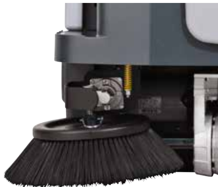
Le système Dustguard™ (disponible en option) permet le contrôle de la poussière sur les balais latéraux pour une plus grande productivité.