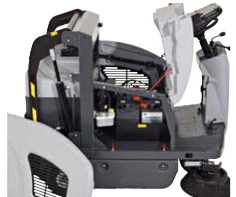
Les balais, les filtres et les panneaux se démontent sans outil pour simplifier et réduire les coûts d'entretien.